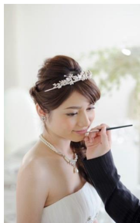
お気に入りの1着に合わせてプロデュース。