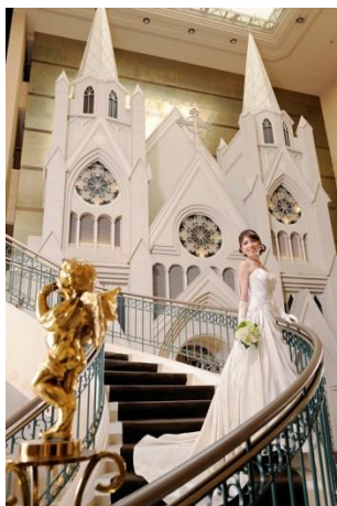
フォトスポットとしても人気のらせん階段。