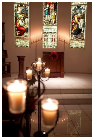
ナイトウエディングにぴったりのキャンドル装飾。