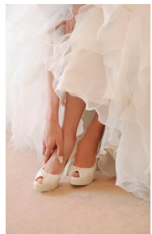
こだわりのアイテムで細部までコーディネート。